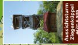
Aussichtsturm Ziegenküppel 447m ü.N.N.H.