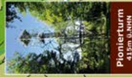
Pionierturm 415m ü.N.N.H.